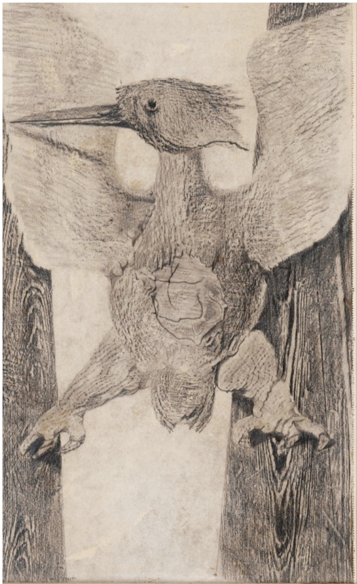
L'origine de la pendule, «Histoire naturelle», 1925.

Au-delà de la peinture de Max Ernst, « l'identité sera convulsive ou ne sera pas »